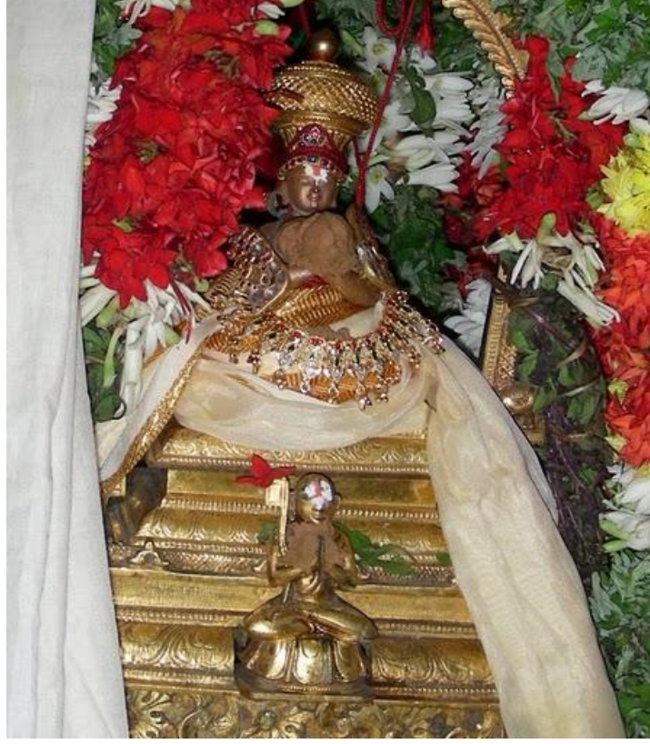
நம்பிள்ளை, ஸ்ரீரங்கம் திருவடியில் பின்பழகிய பெருமாள் ஜீயர்