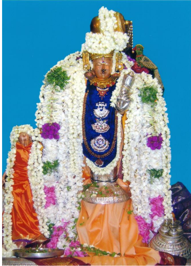
ஸ்ரீஆண்டாள், ஆழ்வார் திருநகரி (இந்த ஸந்நதியை கட்டியவர் ஆத்தான் ஸ்ரீஉ.வே.வேங்கடாச்சார்யர் ஸ்வாமி) - புகைப்பட உதவி – ஆத்தான் ஸ்ரீஉ.வே.ஸுதர்சனராமாநுஜாசாரியார் ஸ்வாமி